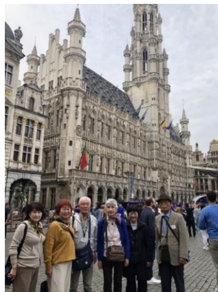
ブリュッセル市庁舎前で