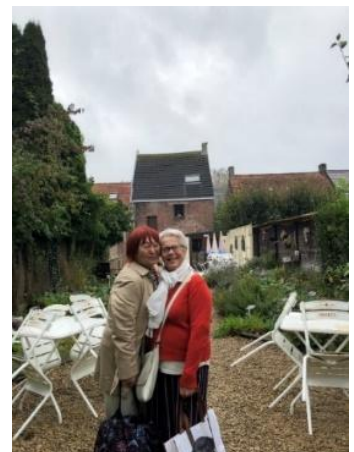
オステンドのハーブガーデン