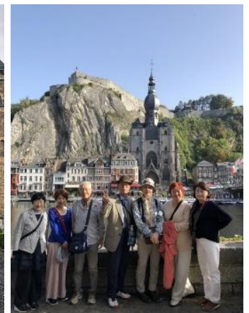
サククス発祥の町ディナン