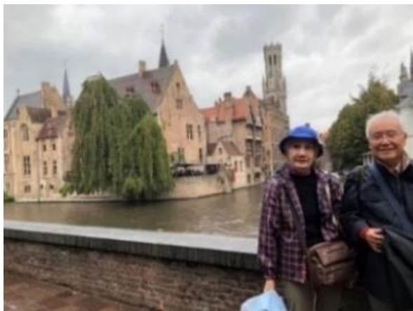
運河とブルージュの美しい風景