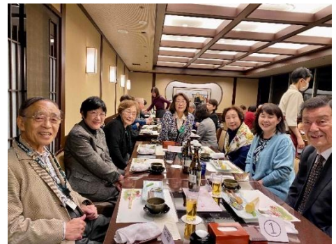
「梅の花」での和やかな懇親会