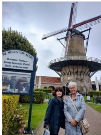
フリースの風車の前

今日はフリーデー。オランダのスロイスまでドライブしたり、近所の海岸を散歩したり、マーケットに足を運んだりアンバサダーとホストがそれぞれの1日を楽しみました。夜はお蕎麦やラーメン、お好み焼き、お味噌汁、ちらし寿司など思い思いの日本料理を感謝の心を込めて料理しました。