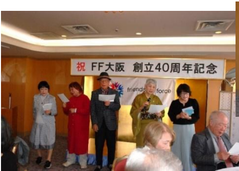
ベルギー渡航メンバーのリードで合唱

OB・OG はじめ懐かしい顔が久しぶりに集まり、盛り上がった会話はいつまでも尽きませんでした。