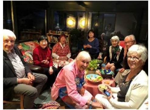
メンバーのカラフルで素敵なうち

夜は、会員宅でグループディナー、ハロウィン料理でもてなしていただき、日本人作家の「レンタルパーソン」が話題になっていると聞いて驚きました。