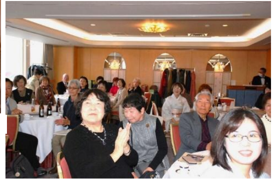
和やかなパーティー風景