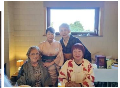
HC ジュリーさん、AC 今井さんお世話になりました