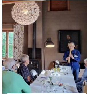
フェアウェルパーティーで尺八を披露

最後にベルジアンコーストのメンバーが披露してくれた「ザベルジアンソング」を聴きました、今回を最後にこのクラブが解散してしまうのが本当に残念に感じました。