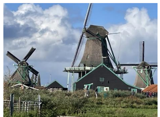
スカンス風車村にて

帰りに5人はオランダのアムステルダム、風車村を見学した。水面下の国土が沈まないように、排水のために、多くの風車が活躍していたが、動力ポンプの普及とともに減少し、保存のため特定の場所に集められている。そのひとつを見学した。帆布を貼ったとても大きな風車は排水だけでなく、木材を切る鋸の動力にも利用されているようだ。