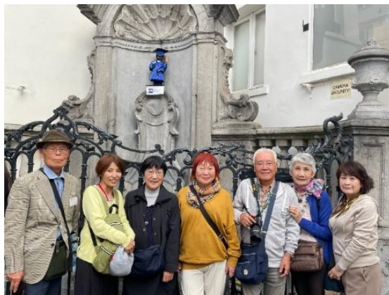
卒業式の衣装を着た小便小僧

オステンドから鉄道でブリュッセルを訪れました。EU 施設について詳しく説明を受けた後、徒歩で一駅グランプラスの広場に一歩足を踏み入れると歴史的な建築物に圧倒されます。大学の卒業式がグランプラスで行われ、学生とその家族で広場は混雑。小便小僧も卒業を祝っていました。