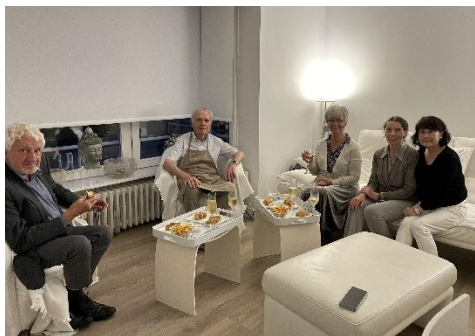
会長 Gaya が夕食に招待 (いなり寿司をふるまう)

それぞれクラブによって受け入れ方は違いますが、基本ホストと過ごすのは朝食と夕食の時、それ以外のドイツツアーにおいては2名程度の会員の方が付きそりやり方で、役割分担がはっきりしていて効率的でホストの方の負担も軽減できているように感じました。