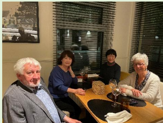
ホスト夫妻とレストランで

最後のフェアウェルパーティーは、ホストファミリーが納屋を改築して造った素敵なゲストハウスで、シェフの美味しい料理をいただき、別れを惜しみながら皆さんと楽しい時間を過ごしました。