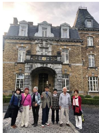
ナミュール古城ホテルにて

翌日は、5つの尖塔を持つヴェーヴ城を見学し、楽しい古城巡りを満喫しました。ブリュッセル拡張の歴史を巡りながらアールヌーヴォーのアーケードを通り中心部へ。壮大なEU本部の設置はベルギーに新しい歴史を加え、ベルギーの底力を感じました。